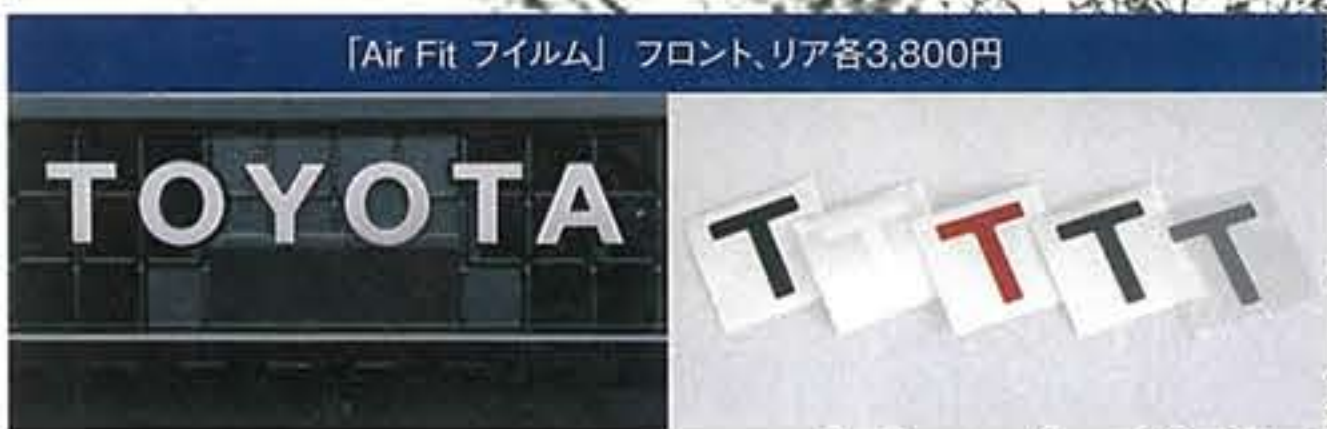
「Air Fit フィルム」 フロント、リア各3,800円