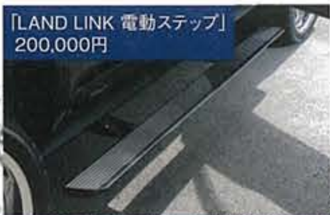
「LAND LINK 電動ステップ」 200,000円