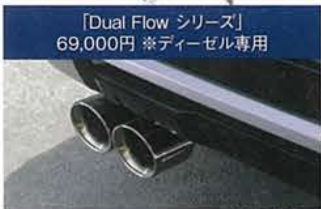
「Dual Flow シリウス」 69,000円 ※ディーゼル専用

レクサスなどのカスタムを得意とする静岡のエスプリ。同社のセンスでカスタムしたのがこのランドクルーザー250となる。「Dual Flow」はリア2本出しが特長のディーゼル専用マフラー。乗員と地面を繋ぐ電動ステップ「LAND LINK」はドア開閉に連動して作動する。TOYOTAエンブレムに貼る「Air Fitフィルム」は施工時に空気が抜ける素材を採用。5色を揃えており手軽なカスタムを楽しむ提案も行っている。