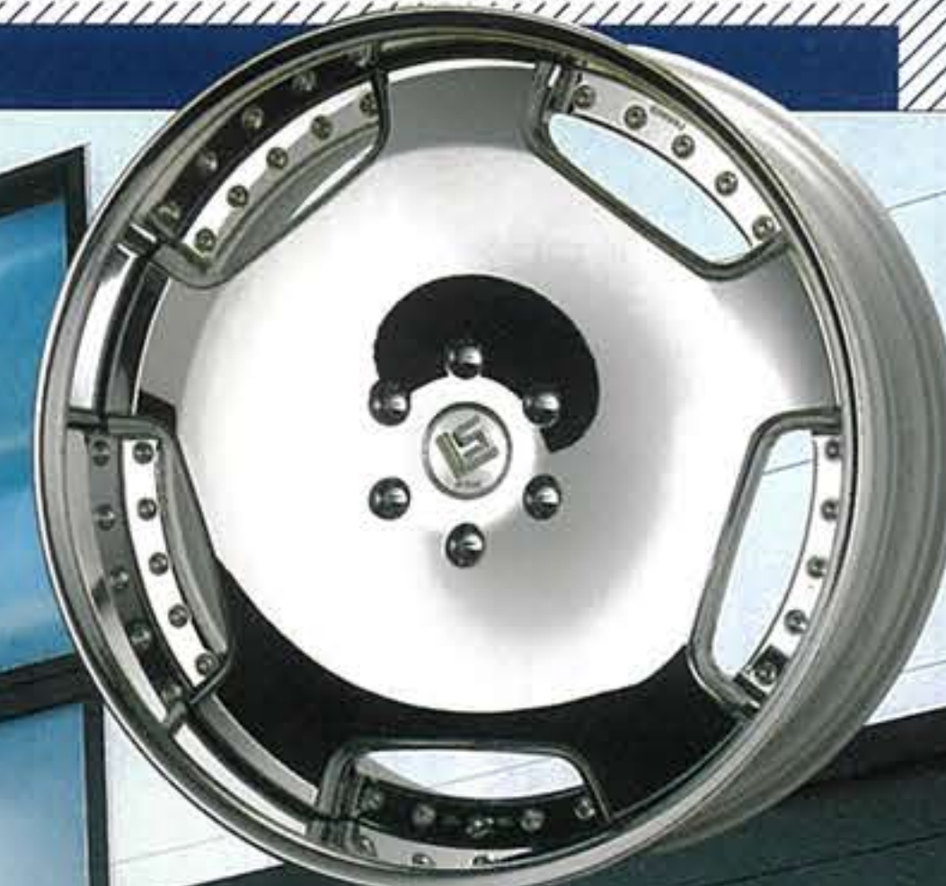
●スーパークロームメッキ・SC

ここまで美しいスタイリングと機能を極めたアルミホイールが、存在したであろうか。ワークの高い美的センスと技術力が織りなす有機的なフェイスデザインと鍛造削り出しによる優れた強度。ダイヤモンドの語源となる「ADAMAS」という名に相応しい圧倒的な存在感とパフォーマンスを誇るLS ADAMASは、ランドクルーザー250など本格4WDを車格を幾倍にも高めてくれる孤高の逸品として君臨するホイールである。