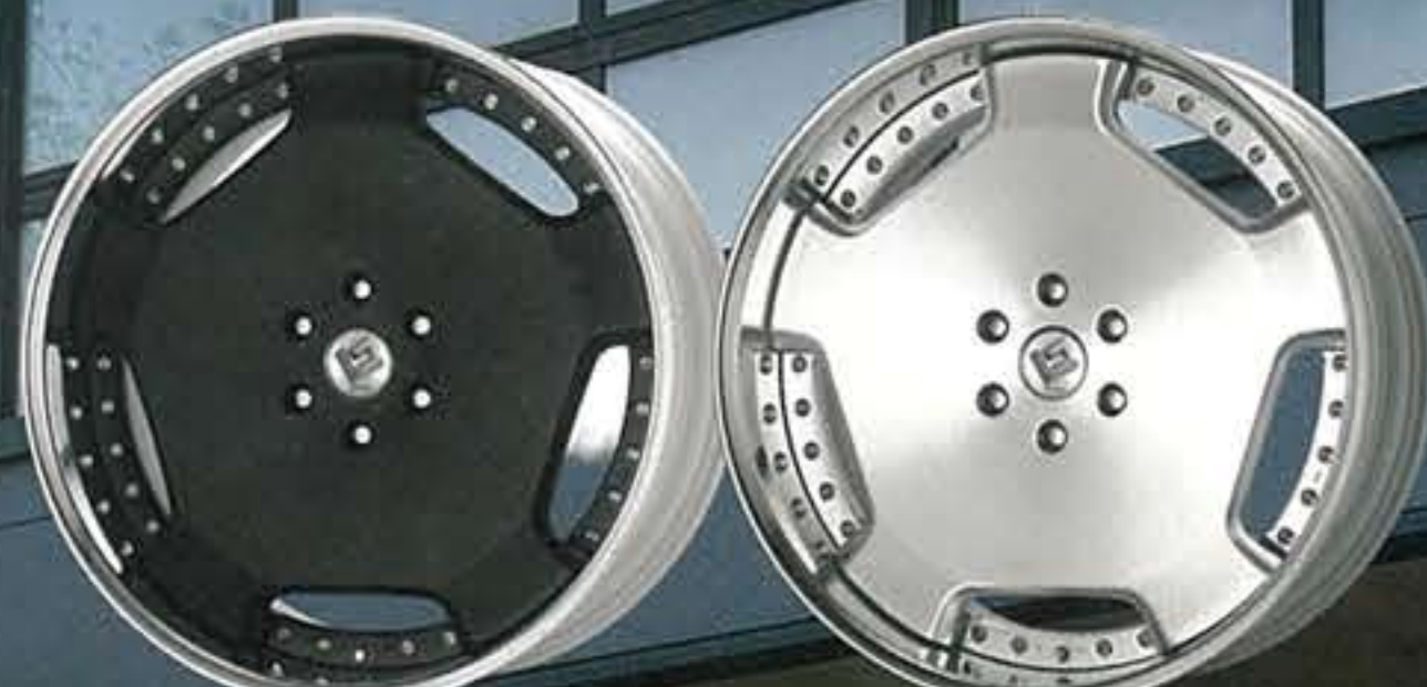
●ブラックアルマイト・SKB