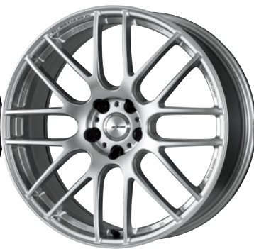
グランツシルバー・GZS 20 (ミドルテーパー)