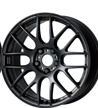
マットブラック・MBL 18 (ミドルテーパー)