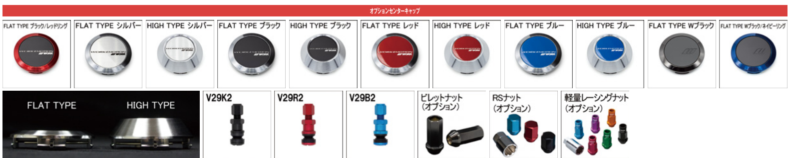
※ナットの詳細について▶P.236