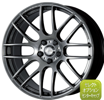
グランツブラック・GZK 20 (ディーブテーパー)