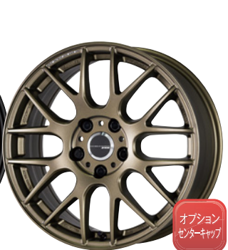
アッシュドチタン・AHG 17 (セミテーパー)