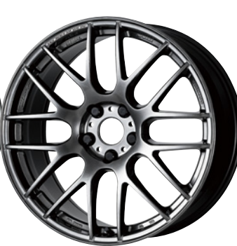
グリミットブラック・GTK 19 (ミドルテーパー)