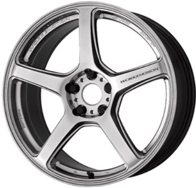
グロースルバー・GSL 19 (ミドルテーパー)