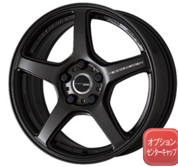
マットグラファイト・MGK 17 (セミテーパー)