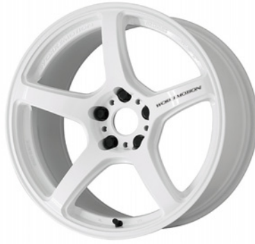
アイスホワイト・ICW 18 (ディープテーパー)