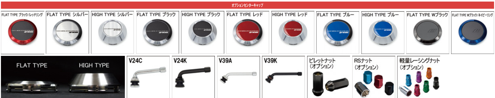
※ナットの詳細について▶P.236