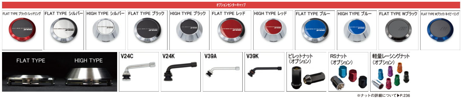
※ナットの詳細について▶P.236