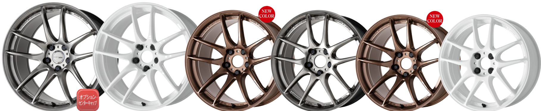
グロガンメタ・GGM 19 (ウルトラディーブテーパ)

M14 標準対応 ※標準P.C.D. 5H-114.3は 取付ボルトM14対応です (座面は60°テーパとなります)