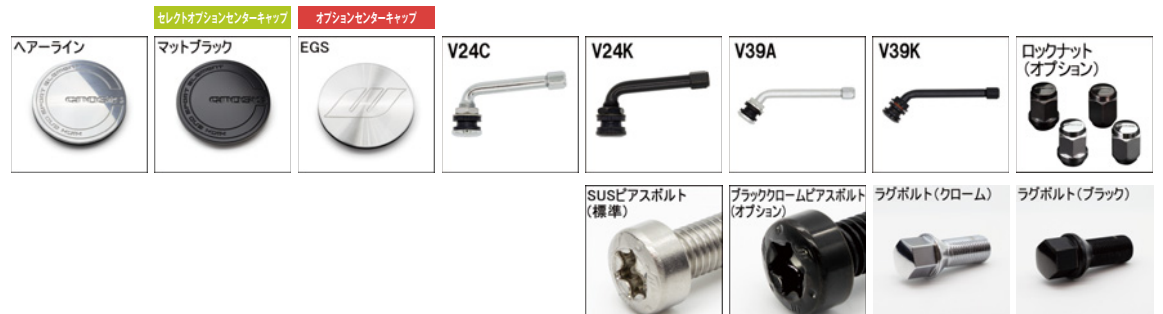
*ラグボルト・ナットの詳細について▶P.236~237