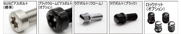
※ラグボルト・ナットの詳細について▶P.236~237