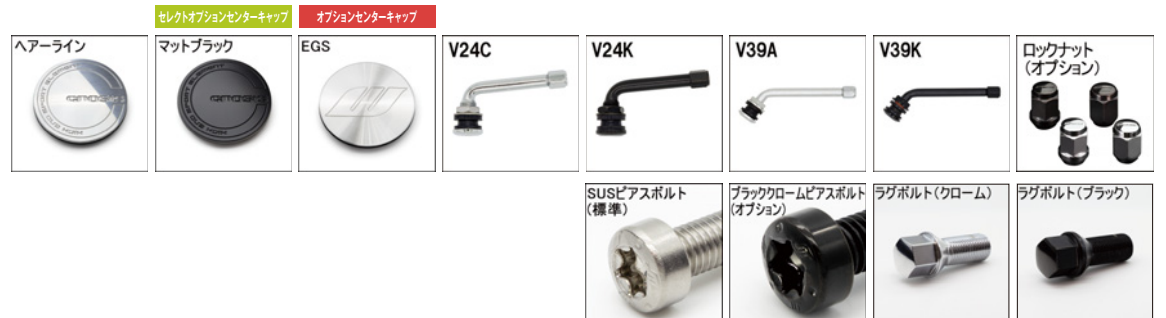
※ラグボルト・ナットの詳細について▶P.236~237