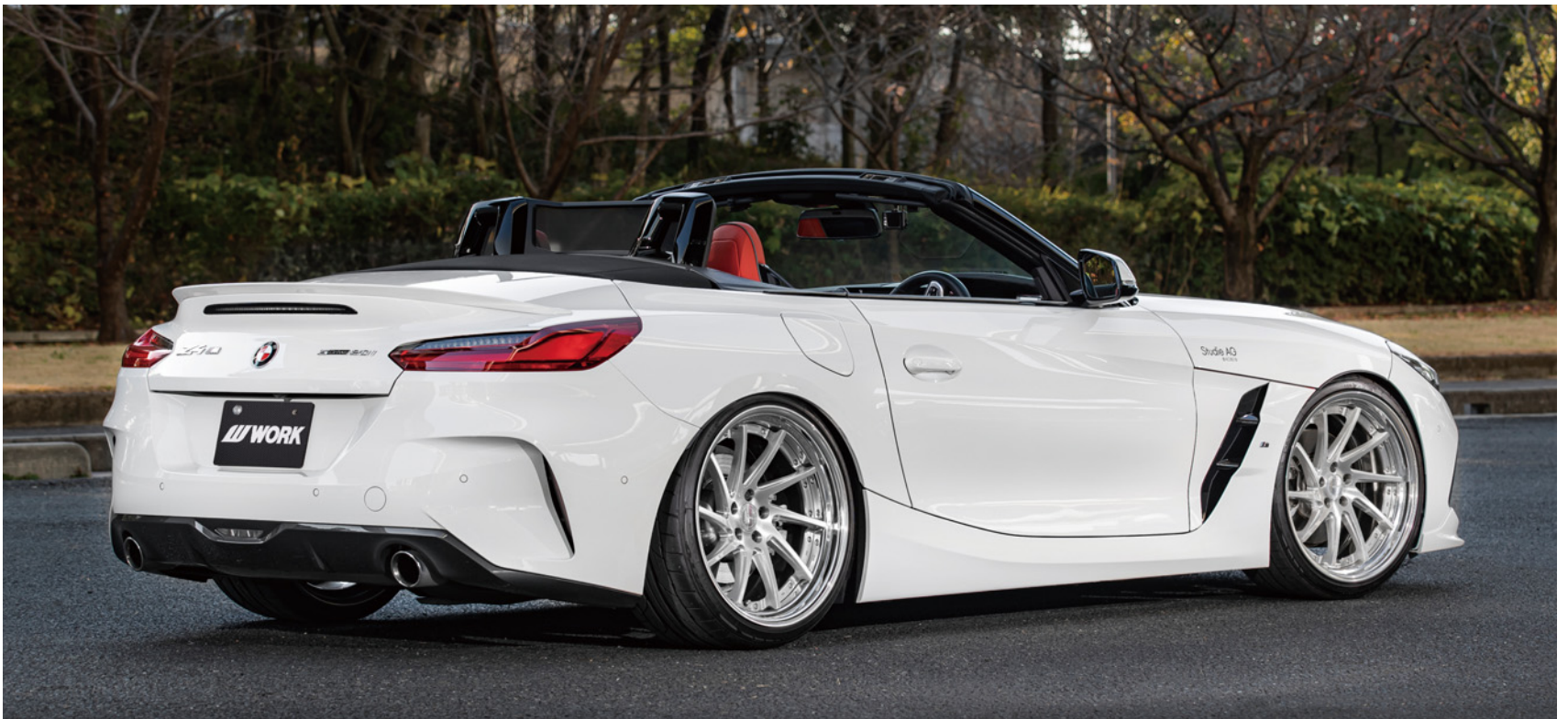
※表着画像はイメージです。