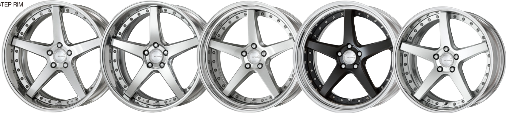
コンポジットパフブラッシュド・PBU 20 (ディープコンケイブ)