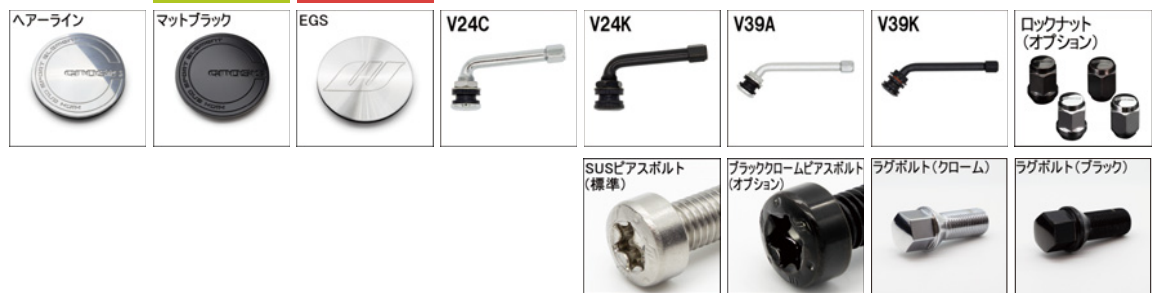
*ラグボルト・ナットの詳細について▶P.236~237