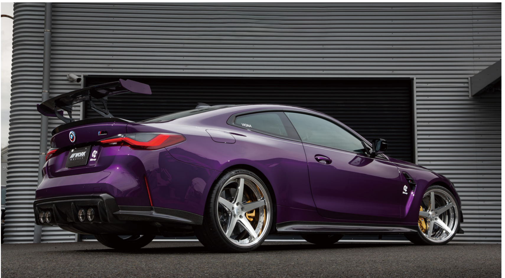
*装着画像はイメージです。