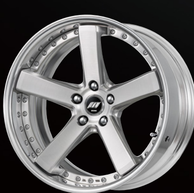
ブラッシュド・BRU 19 (ディープコンケイブ)