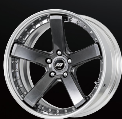
プリリアントシルバーブラック・BSB 19 (ディープコンケイブ)