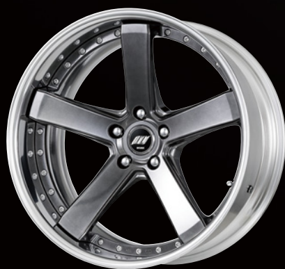
プリリアントシルバーブラック・BSB 20 (ミドルコンケイブ)