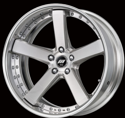
ブラッシュド・BRU 20 (ディープコンケイブ)