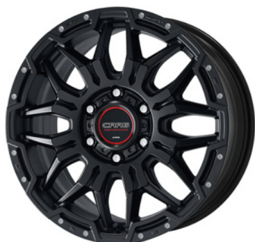
マットブラックピアスマシニング・MBLPM