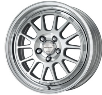
カットクリア・MSP SR 17