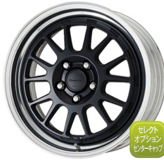
マットブラック・MBL SR 17