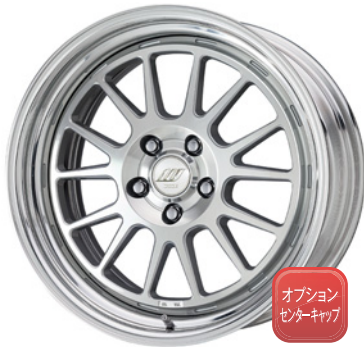
カットクリア・MSP SR 18