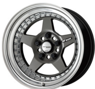
マットカーボン・MGM