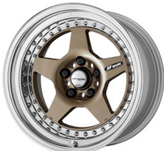
チタンゴールド・HPG