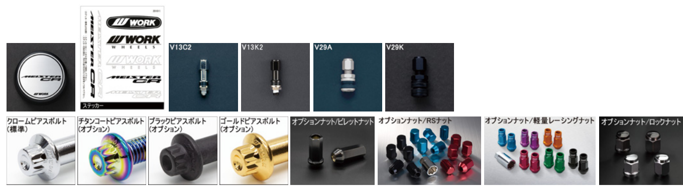
※ナットの詳細について▶P.254 ※装着画像はイメージです。

●カラー: マットカーボン (MGM)/チタンゴールド (HPG)/ハブフィニッシュ (PP) ●セミアダールカラー: 同価格 * WORK 指定のカラーよりお選びいただけます。詳しくはお問合せください。 * 付属品: エアバルブ1個 (V29A・★は V13C2)・センターキャップ1個・ステッカー1枚 ●★は 4H-100 のみの設定となります。 * パーフアルマイトリムが標準となります。 * 車両によりセンターキャップが装着できない場合があります。 * 製造条件により対応できない場合があります。 * 仕様により多少納期がかかる場合があります。 * ハブ高さクリアランスの数値は、取付面からセンターキャップまでの参考値です。 上記のハブ高さ以下であっても車両ハブ形状によっては接触する場合があります。