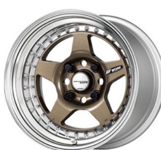
チタンゴールド・HPG