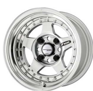
パフフィニッシュ・PP