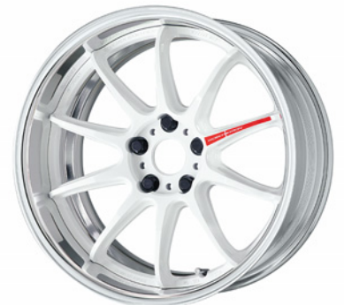
アズールホワイト・AZW 18 (ディープコンケイブ)