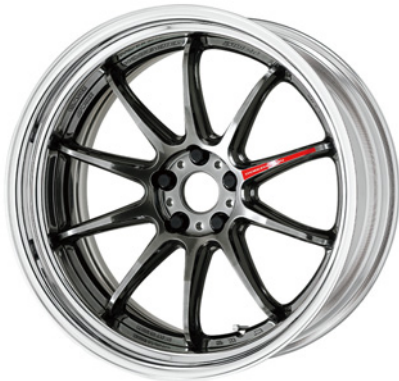
グリミットブラック・GTK SR 20 (ディープコンケイブ)