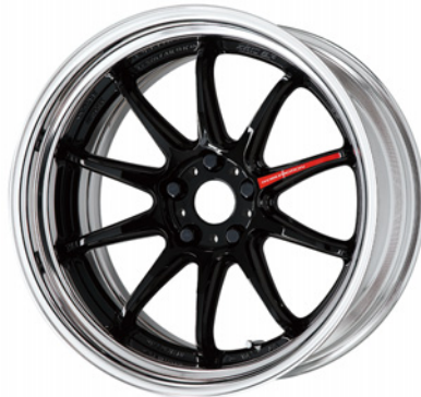
ブラック・BLK SR 19 (ディープコンケイブ)