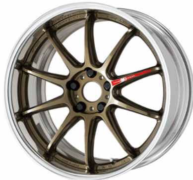
チタンブロンズ・HG 19 (ミドルコンケイブ)