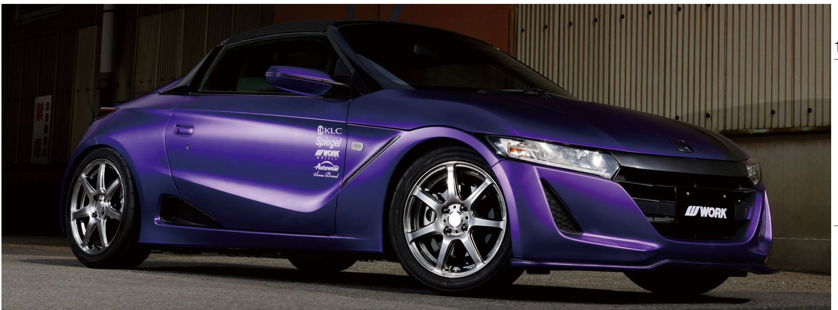
※装着画像はイメージです。