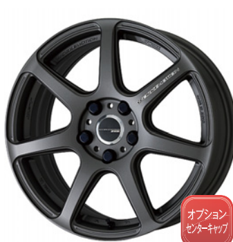
マットカーボン・MGM 17