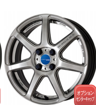
グリミットシルバー・GTS 16