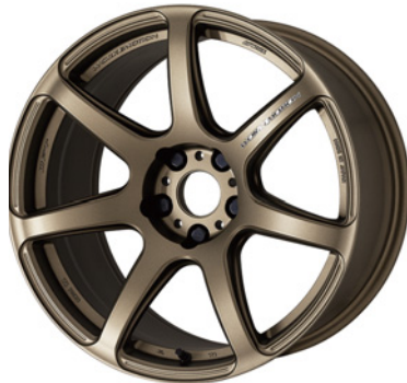
アッシュドチタン・AHG 18 (ディープテーパー)