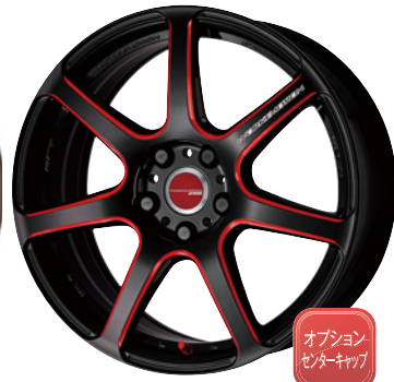
kurenai・BRM 18 (セミテーパー) (セレクトオプション:エアバルブ) ※P139の専用サイズベックをご確認ください