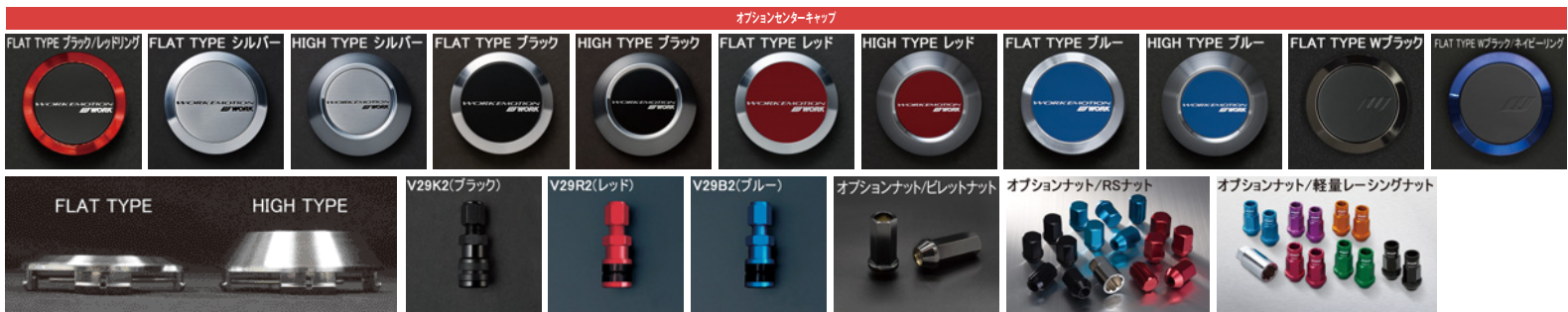
※ナットの詳細について▶P.254