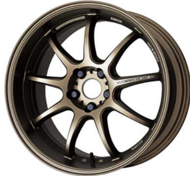
アッシュドチタン・AHG