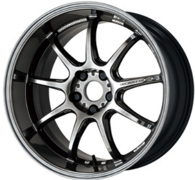
グリミットブラック・GTK