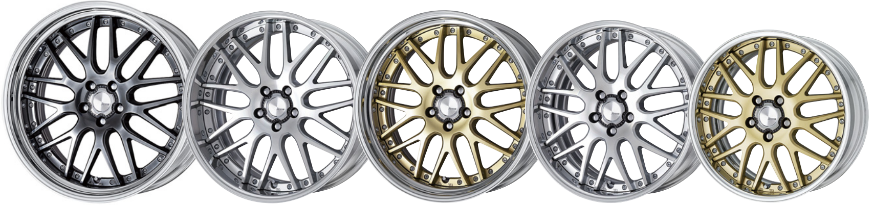
グリミットブラック・GTK