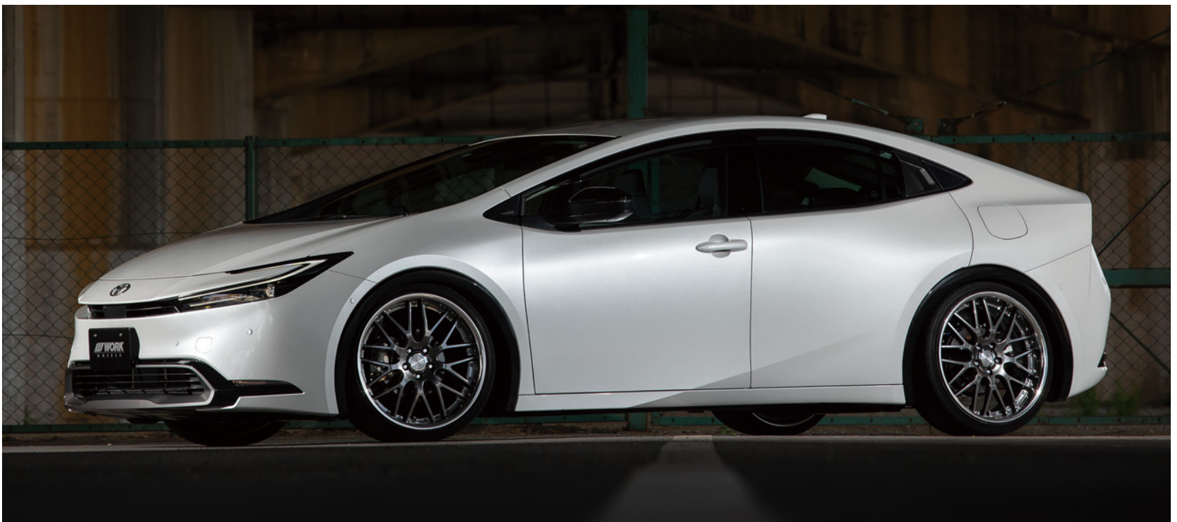
※装着画像はイメージです。