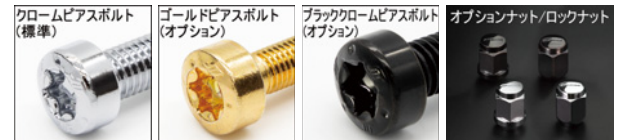
※ナットの詳細について▶P.254