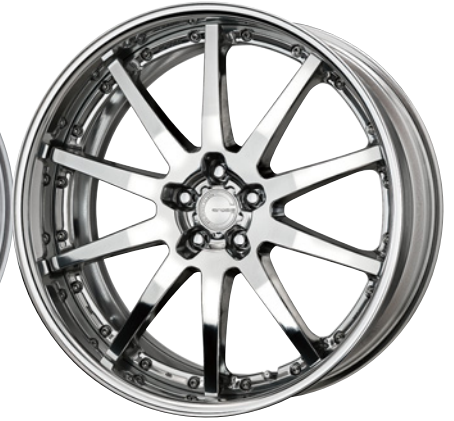
パフフィニッシュ・PP2 22 (オプションカラー)