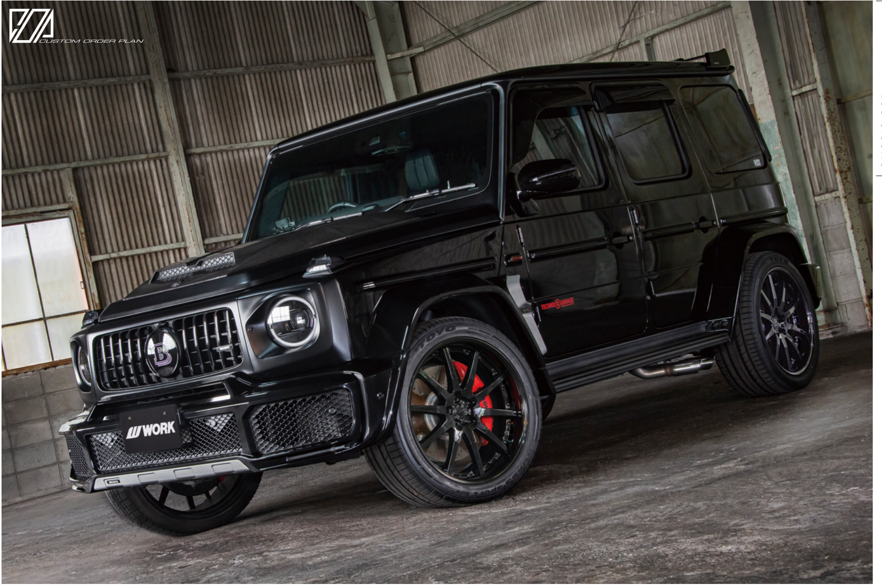
※装着画像はイメージです。