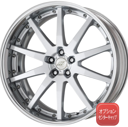
マットシルバー・MSL 22