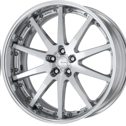
コンポジットパフブラッシュド・PBU 22 (オプションカラー)