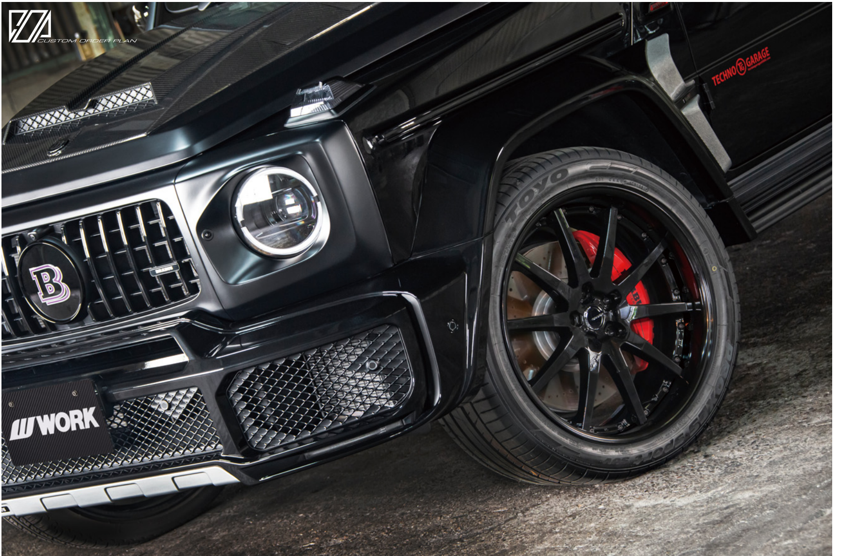
※装着画像はイメージです。