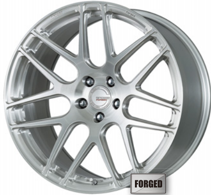
ブラッシュド・BRU 20 (ウルトラディープコンケイブ)