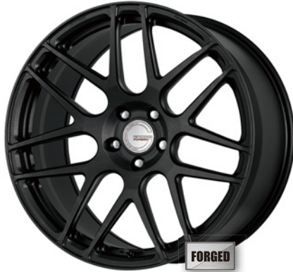
ブラックアノダイズド・SKB 20 (ディープコンケイブ) ブラックエアバルブ仕様