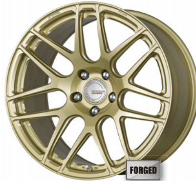
ペイント/プラチナゴールド・PG 19 (ウルトラディープコンケイブ)