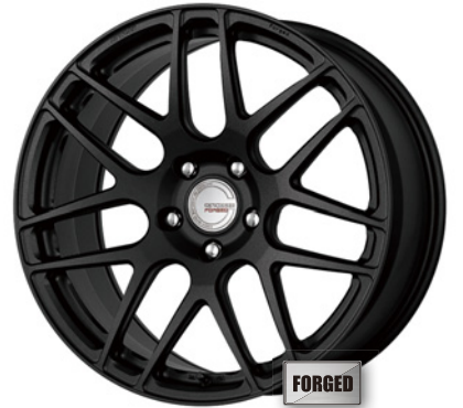
ブラックアノダイズド・SKB 19 (ミドルコンケイブ) ブラックエアバルブ仕様