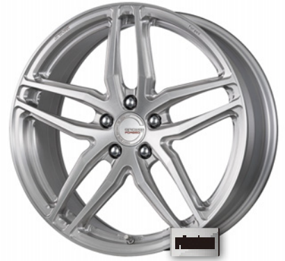
ブラッシュド・BRU 19 (ミドルコンケイブ)