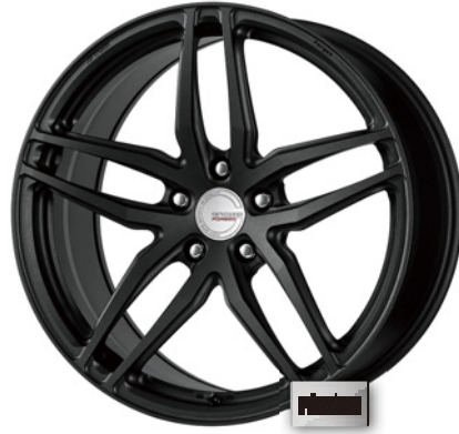
ブラックアノダイズド・SKB 20 (ディープコンケイブ) ブラックエアバルブ仕様