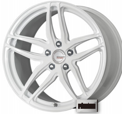
ペイント/ホワイト・WHT 19 (ウルトラディープコンケイブ)