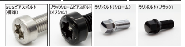
※ラグボルト・ナットの詳細について▶P.254~255