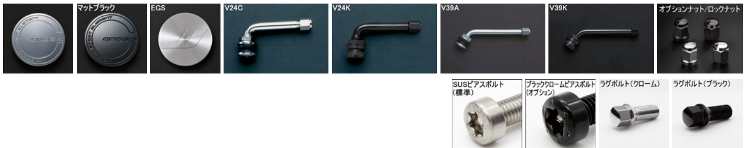
※ラグボルト・ナットの詳細について▶P.254~255