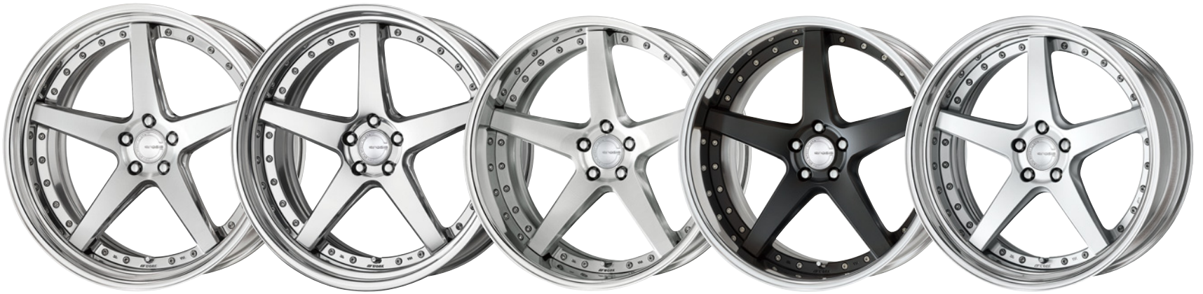
コンボジットハブブラッシュド・PBU SR 22 (ディープコンケイブ)