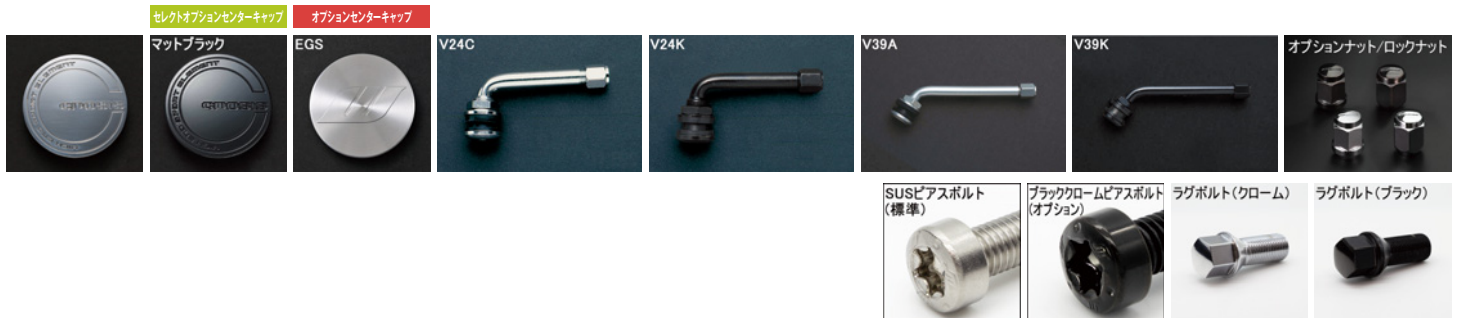
※ラグボルト・ナットの詳細について▶P.254~255