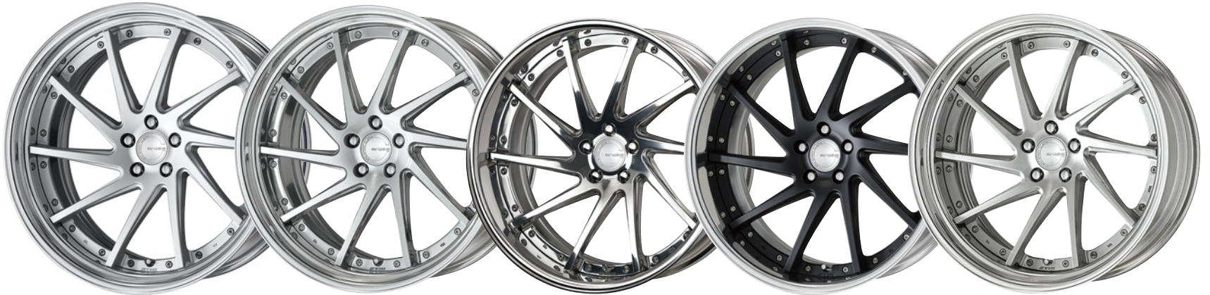
マットシルバー・MSL SR 22 (ディープコンケイブ)