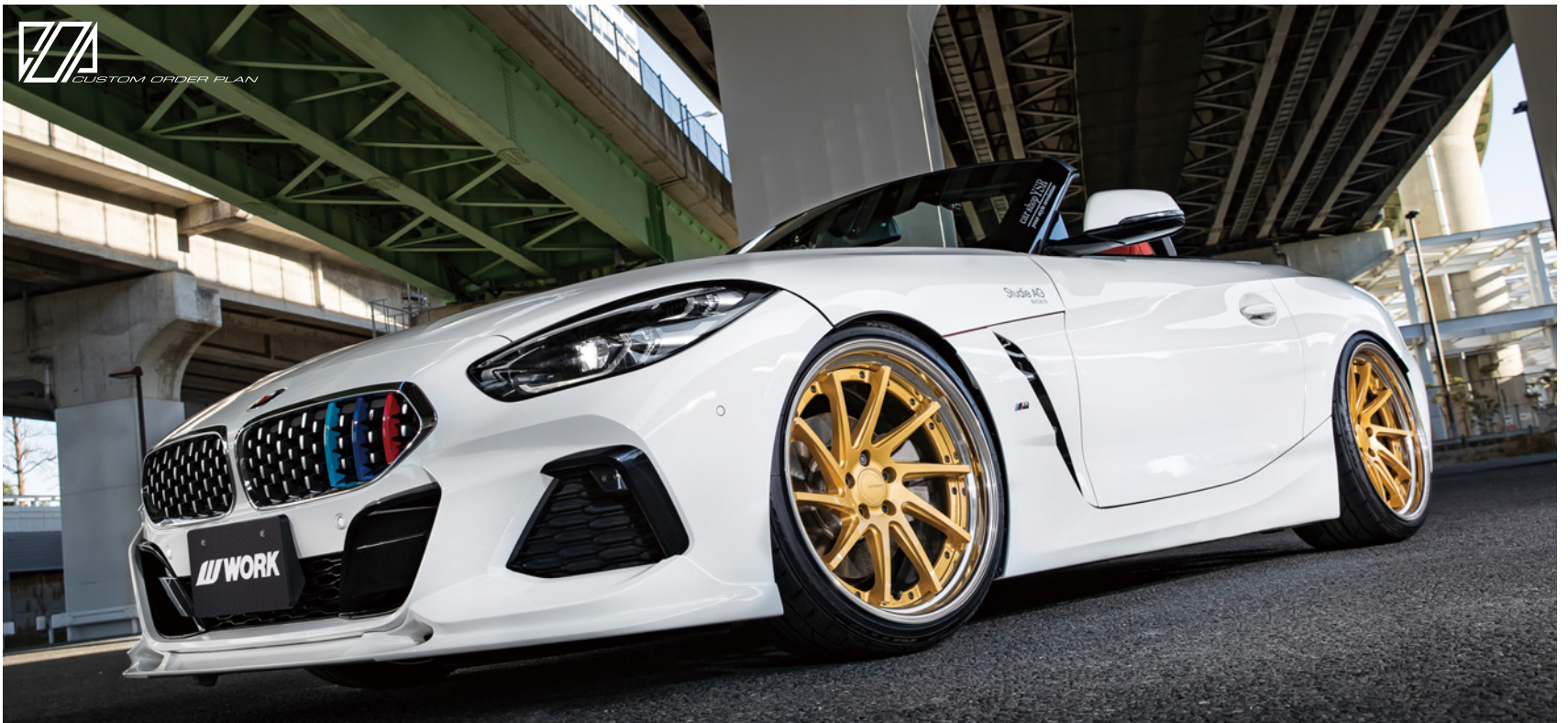
※装着画像はイメージです。