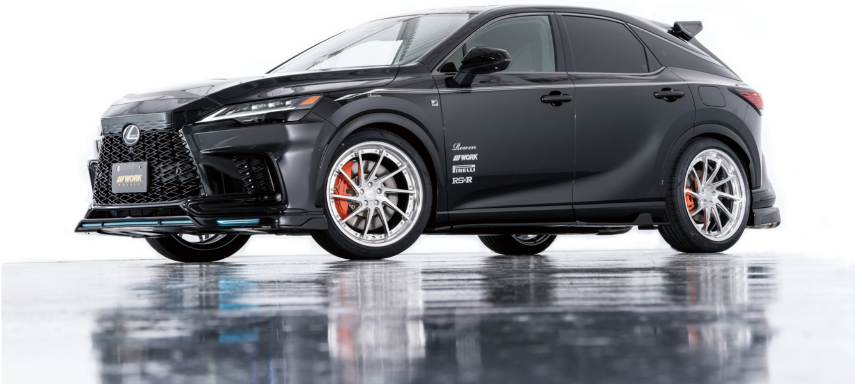
※装着画像はイメージです。