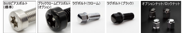
※ラグボルト・ナットの詳細について▶P.254~255