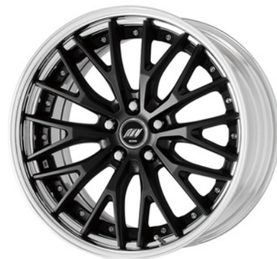
マットブラック・MBL