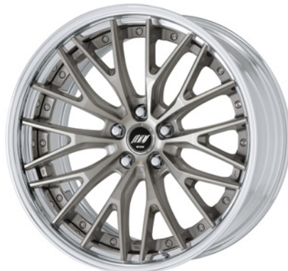
トランスグレーポリッシュ・TGP