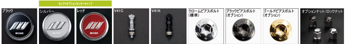
※ナットの詳細について▶P.254