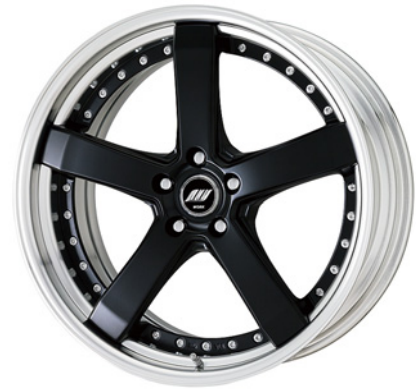
マットブラック・MBL SR 20 (セミコンケイブ)