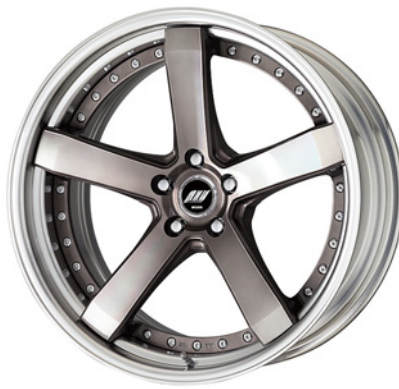
トランスグレーポリッシュ・TGP SR 20 (ミドルコンケイブ)