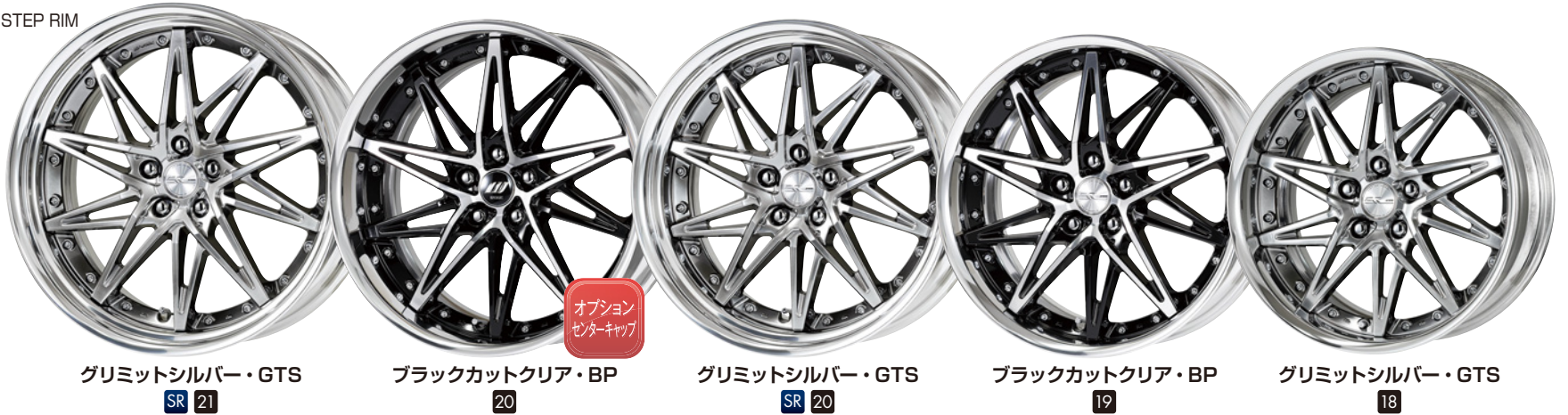
グリミットシルバー・GTS