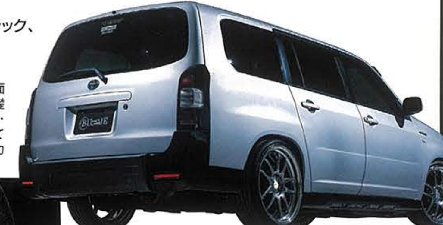
装着ホイール&タイヤサイズ 18×7.5J IN33/29 & 205/35R18

両サイドをセンターよりも少し落とし込んだデザインで、たくましさや立体感を表現するブルボックスのリアバンパーだが、ブロックデザインを持つフロントバンパー&サイドステップとともに黒一色にすれば、サゲに映えるカタマリ感をボトムに与えられる。