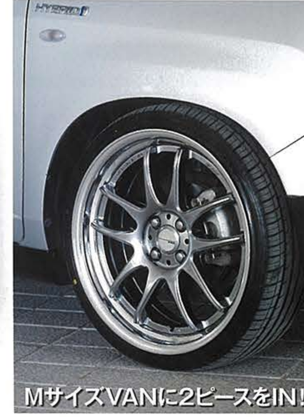
MサイズVANに2ピースをIN!!

スポークサイドにリブを加えることで天面のスリムさだけでなく、スポーティさの礎となる強度を高めたワークエモーション・CR2P。スポークエンドを鋭角に立ち上げてコンケープとリムの深みをダブルで稼ぐ迫力も要チェックな1本だ。