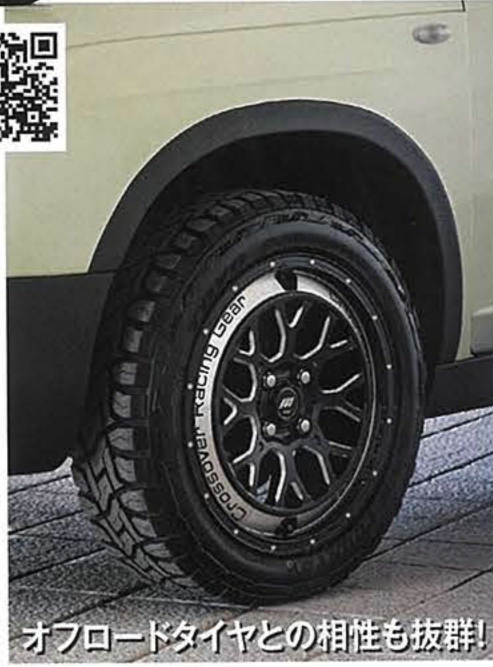
オフロードタイヤとの相性も抜群!