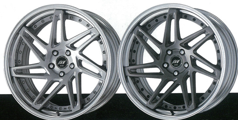
B SET (ブラックピエスホスト / ブラックエアバルブ) 仕様

サイズ:20×8.0J～20×11.5J ¥84,000～106,000(税別) ※特殊PCDにて輸入車対応/特殊PCDは¥6,000アップ カラー:ブラック(BL) / トランスブルー(GTR) / マットブラック(MDL) 構造:鉄造 2ピース 付属品:センターキャップ、エアバルブ