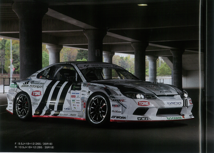
F: 9.5Jx18+12(265 / 35R18) R: 10.5Jx18+12(285 / 35R18)