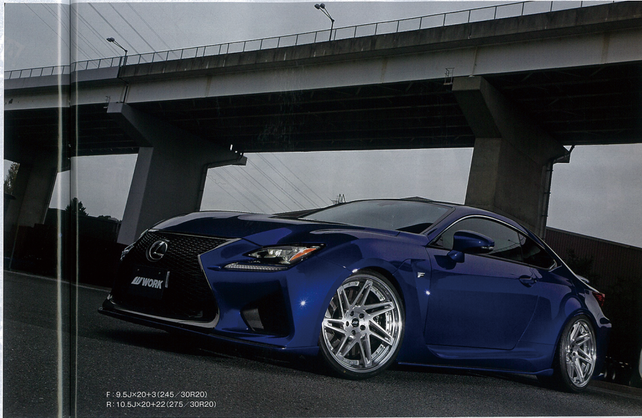
F: 9.5J×20+3(245/30R20) R: 10.5J×20+22(275/30R20)

※価格はディスクカバー 「17インチブラックメタリック」「18インチブラックメタリック」「19インチブラックメタリック」の順 ※価格はすべて税抜価格に ※「17インチブラックメタリック」はオプションでオーダー可能 ※「18インチブラックメタリック」はオプションでオーダー可能 ※「19インチブラックメタリック」はオプションでオーダー可能 ※「17インチブラックメタリック」「18インチブラックメタリック」「19インチブラックメタリック」はオプションでオーダー可能