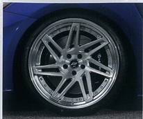
絶妙な光沢感で仕上げられたカットアルミリムとヘアライン調のブラッシュドディスクで輝き色アレンジ極めたST3。コーナースタート時の加速感とタイヤのグリップの7本スポークで上質な躍動感を感じられる。

オーダーインセットが可能なら、テップオーバーディスクで、大口径感と立体感の双方を高次元でバランスさせるワークのフィニッシュ。17インチ、18インチのST1、5本スポークのST2といった従来バ