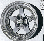
バフファイニッシュ

マイスターCR01に通常ラインナップされているカラーは、バフアルマイトのリムに、ツヤ消しの質感がしびれるマットカーボン、5本スポークの存在感を増すチタンゴールド、リムと同様にピッチと輝くバフファイニッシュの3カラー。カスタムオーダープランのカラーリングを入れると全12色