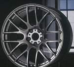
クリミットブラック (GTK)