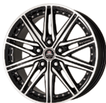
ブラックカットクリア (BP) 17