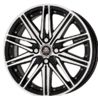
ブラックカットクリア (BP) 16