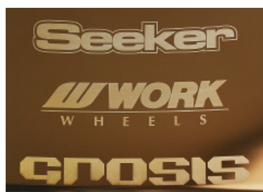
ブロンズアルマイトリム