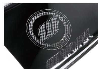
ブラックアルマイトリム