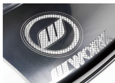
パパールマイトリム