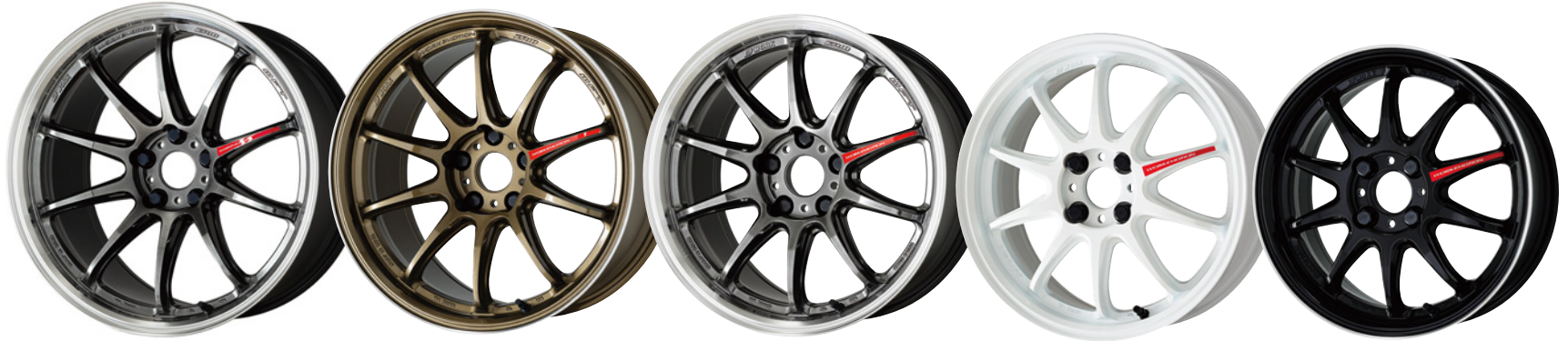
グリミットブラックダイヤカットリム GTKRC 19 (ウルトラディープテーパ)