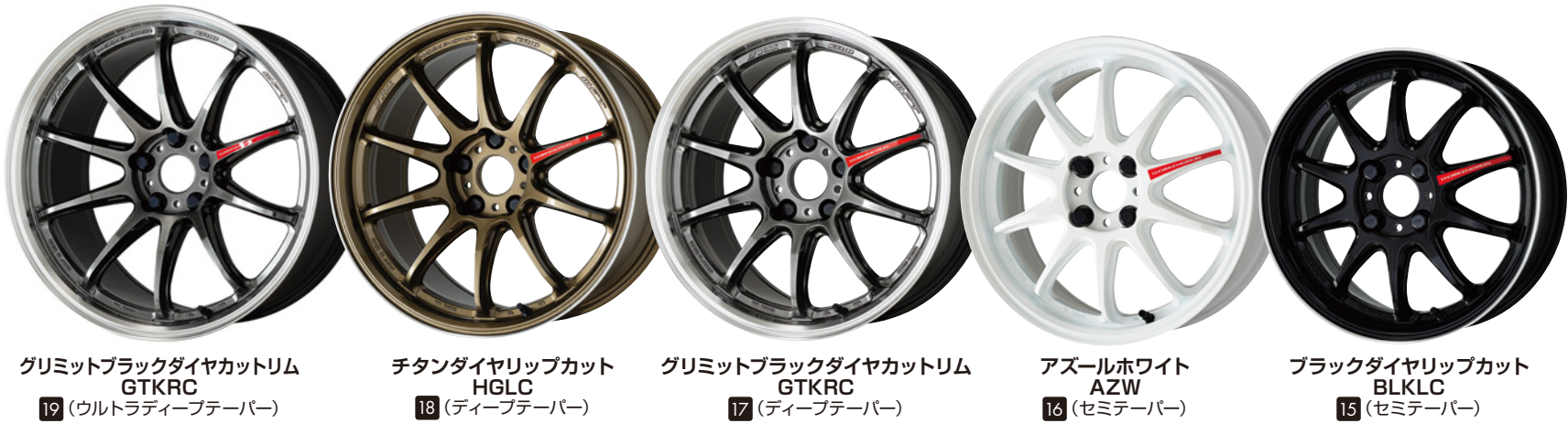
グリミットブラックダイヤカットリム GTKRC 19 (ウルトラディープテーパー) チタンダイヤリップカット HGLC 18 (ディープテーパー) グリミットブラックダイヤカットリム GTKRC 17 (ディープテーパー) アズールホワイト AZW 16 (セミテーパー) ブラックダイヤリップカット BLKLC 15 (セミテーパー)