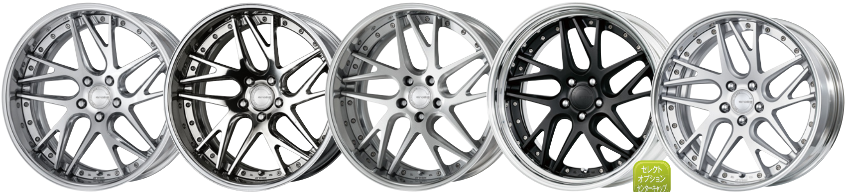
コンボジットバフブラッシュド・PBU 20 (ディープコンケイブ)