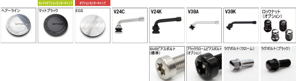
※ラグボルト・ナットの詳細について▶P.236～237