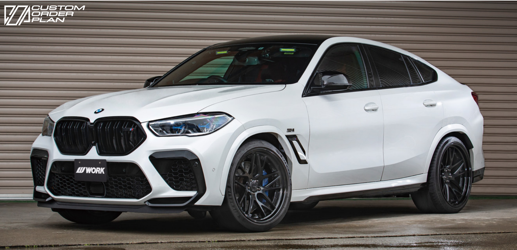
※装着画像はイメージです。