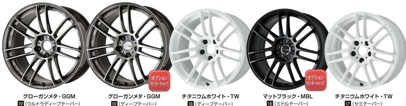
グロガンメタ・GGM 19 (ウルトラディープテーパ)

※標準P.C.D. 5H-114.3は 取付ボルトM14対応です (座面は60°テーパードとなります)