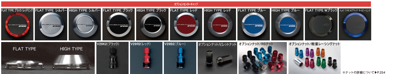
※ナットの詳細について▶P.254